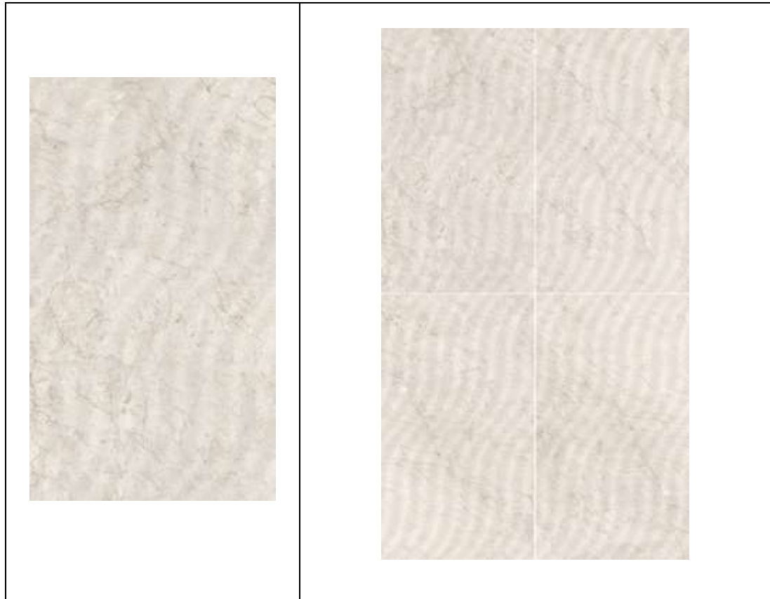
CARAS DEL PRODUCTO